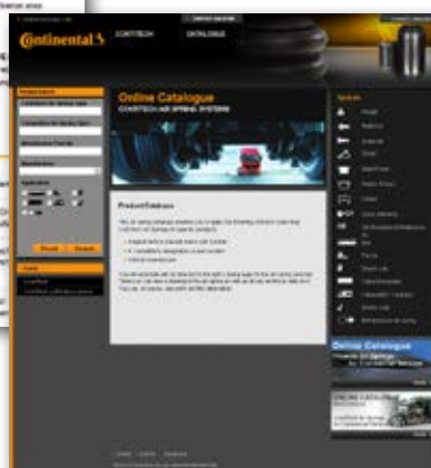
▲ Online-Katalog www.luftfederkatalog.de