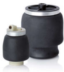
司机座椅悬置的袖式空气弹簧