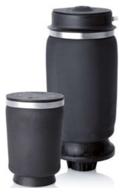
车轴悬架的袖式空气弹簧

当今, 人们无论是驾驶公路车辆还是非公路车辆都有权要求符合人体工程学的舒适工作环境, 为此我们付出全部的核心竞争实力: 精密研发的基于弹性体的空气弹簧系统, 凭借其高技术功能在实用中表现优异、令人满意。