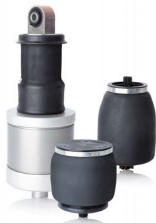
驾驶室悬置的袖式空气弹簧